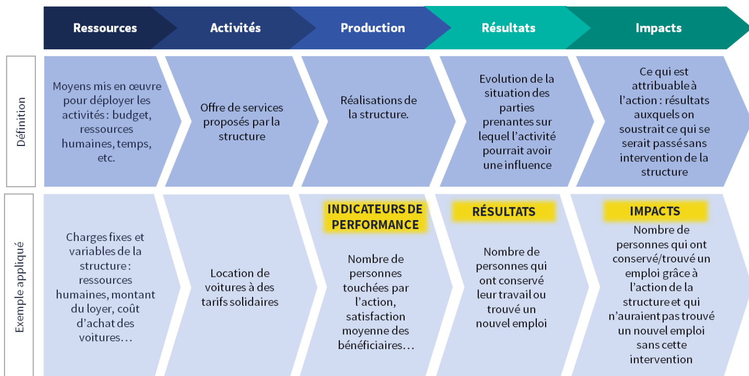
Chaîne de valeur de l'impact

La chaîne de valeur de l'impact : quand on réfléchit à mesurer son impact, il est nécessaire de comprendre ce que l'on mesure. En effet, l'impact doit être distingué des activités, de la performance ou encore des résultats de son projet. La Figure ci-dessous illustre cette chaîne de valeur de l'impact en reprenant l'exemple d'un garage solidaire, dont la mission sociale est de permettre la (ré)insertion de personnes précaires sur un territoire rural donné, grâce à la location de véhicules à des tarifs solidaires.